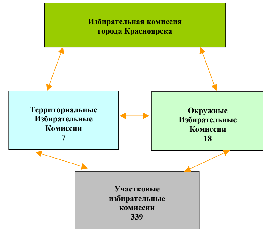
СХЕМА избирательных комиссий на выборах Главы города Красноярска и депутатов Красноярского городского Совета