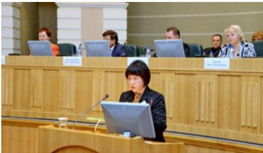
VIII конференция АСДГ 26-27 сентября 2013 года, г. Омск «Особенности правоприменительной практики при проведении муниципальных выборов в условиях реформирования избирательного законодательства Российской Федерации»