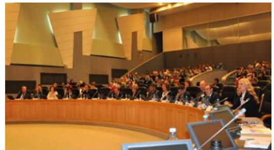
IX конференция АСДГ 9-10 октября 2014 года, г. Тюмень «Современные тенденции развития института выборов муниципальной власти в условиях реализации реформы местного самоуправления в Российской Федерации»